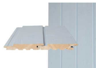
GOLD PRO UTS Pystypanelointi