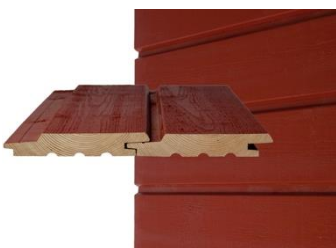
GOLD PRO UTW Vaaka- ja pystypanelointi