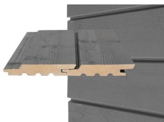
GOLD PRO UTW Vaakapanelointi